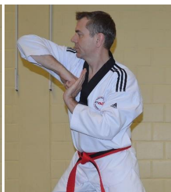
PalKeup dolyo chigi