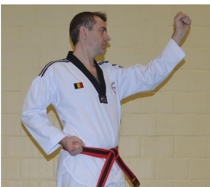
Me jumok naeryo chigi