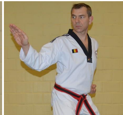
Hansonal yop maki